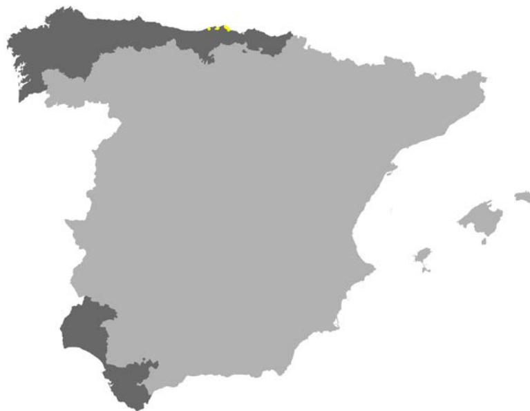
Figura I.32. Distribución del hábitat 2190 en la red Natura 2000 de las provincias de la Región Biogeográfica Atlántica de la Península Ibérica (Fuente: MMARM, 2009).