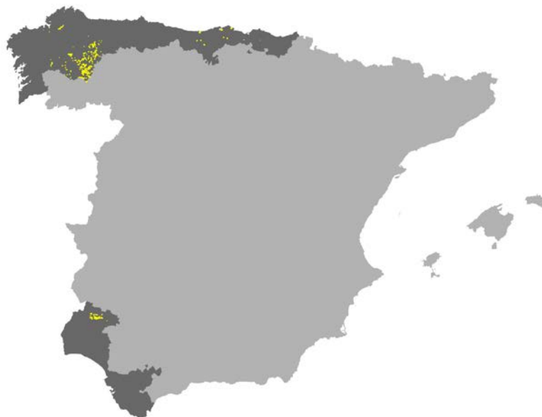
Figura I.54. Distribución del hábitat 9260 en los LICs acuáticos de Cantabria y en la red Natura 2000 de las provincias de la Región Biogeográfica Atlántica de la Península Ibérica (Fuente: MMARM, 2009).